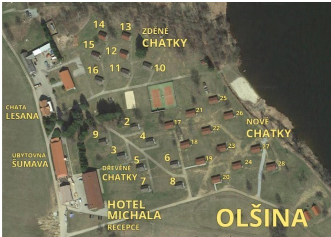
Obrázek číslo 4 – situační plán ubytování Olšina