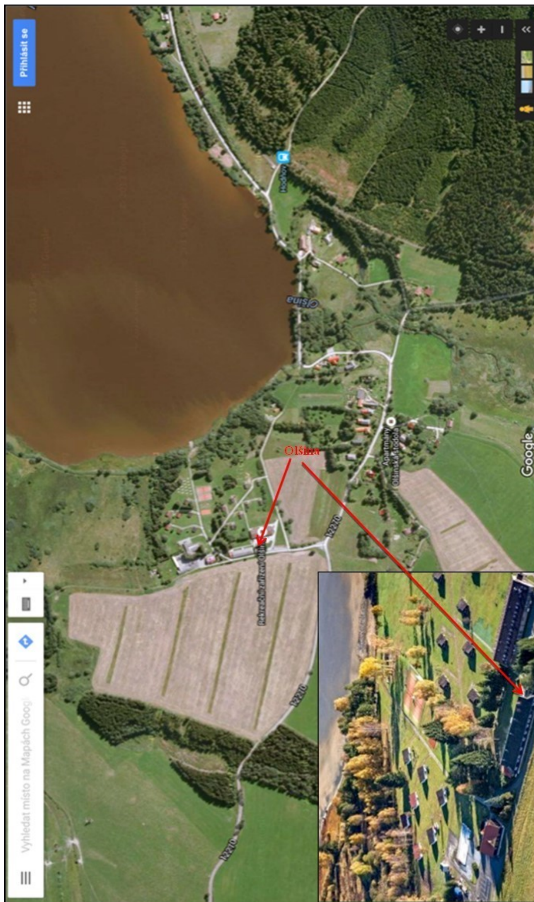
rázek číslo 3 – situační plán místo registrace Olšina